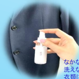
なかなか洗えない衣類に